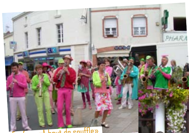
Fanfare «A bout de souffle»

Le 23 septembre dernier le Champilambart a investi le marché de Vallet. L'école de musique de Vallet a débuté cette matinée en chanson. La fanfare déjantée «A Bout de Souffle» est arrivée de Douarnenez pour mettre l'ambiance et a pu goûter au vin nouveau avec tous les promeneurs de ce dimanche matin. Le clou du spectacle reste la représentation de Cyclone par la compagnie nantaise de danse hip hop KLP sur le parvis de l'église. Compagnie que vous pourrez retrouver le 1er avril prochain, dans le cadre du festival Cep Party, pour une représentation de Sissa où énergie, pulsion et fougue seront au rendez-vous !