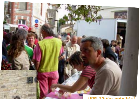
... une pause méritée!