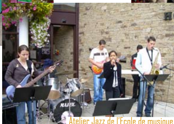
Atelier Jazz de l'École de musique